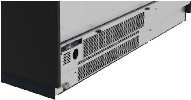
Removable and easily accessible compressor filter Filtre du compresseur amovible et facilement accessible