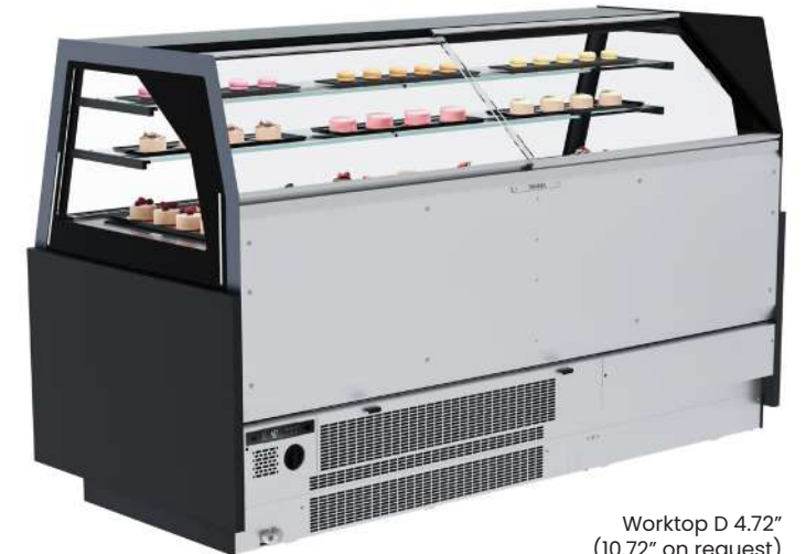
Worktop D 4.72" (10.72" on request) Plan de travail D 120 mm (270 mm sur demande)