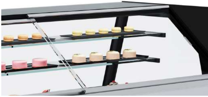
HCS rear closure system with sliding doors Système de fermeture arrière avec plexis coulissants HCS