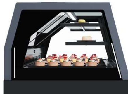
Optimised shelves position Positionnement optimisé des étagères