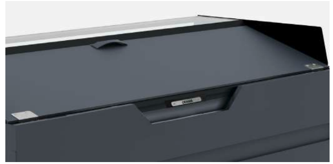
HCS PRO rear closure system with panel Système de fermeture arrière avec panneau HCS PRO