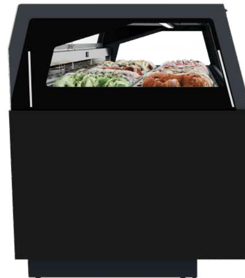
Elegant silk-screen printing on side glasses Sérialographie élégante sur les panneaux latéraux

Le design d'Orama met en valeur vos créations, invitant les clients à se faire plaisir avant même de les goûter. L' inclinaison de la vitre frontale et l'affleurement des bacs à celle-ci permettent aux produits d'être visibles de loin. La structure de la vitrine est conçue pour offrir une transparence sans compromis : le vitrage autoportant à double vitrage est entièrement composé de verre pyrolytique, chauffé et trempé , tant à l' avant qu'à l' arrière , ce qui garantit une protection maximale contre la condensation et une grande efficacité énergétique. L'éclairage LED 4000K , uniforme et diffus, met en valeur les couleurs et les détails, tandis que les étagères du service de Pâtisserie mettent en valeur vos spécialités, garantissant une présentation impeccable.